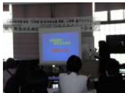
高校生活のDVDを観る

2時間半のプログラムはあっという間に終わりました。終わってから、生徒や保護者たちが先生や通訳者と、おしゃべりする様子がみられました。新入生の高校生活のスタートを応援する、このオリエンテーション。「自分ひとりではない」という安心感と、高校生活への希望をもってもらうために、これからも開催していきたいと思います。通訳や資料